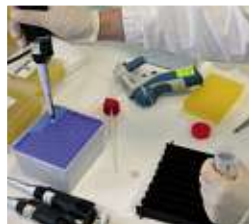
Il kit diagnostico ideato e brevettato da AB Analitica per l'individuazione del batterio causa di gastriti e ulcere è il fiore all'occhiello dell'azienda padovana.

Turchia, Grecia, Polonia, Spagna, ma anche Cina dove è in corso di registrazione un suo prodotto. Nel 2006 l'Associazione "Amici della Zip" [www.amicidellazip.it], su proposta di Confindustria, le ha conferito il Premio per l'innovazione.